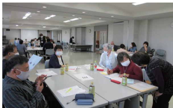
柏市の「風早北部地域支え合い会議」での討議風景

この総会に提出された議案等の全文については、紙面の都合で掲載することは省略しますが、皆様に関連のあります主な内容についてご紹介いたします。