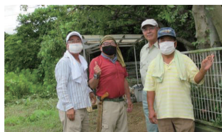
草刈作業に携わる協力会員の皆さん