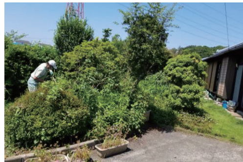
この時期の雑草や枝葉の伸びは大変です！